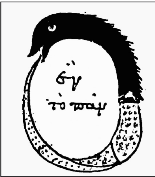
Chrysopoeia de Cleopatra: “Todo es Uno”