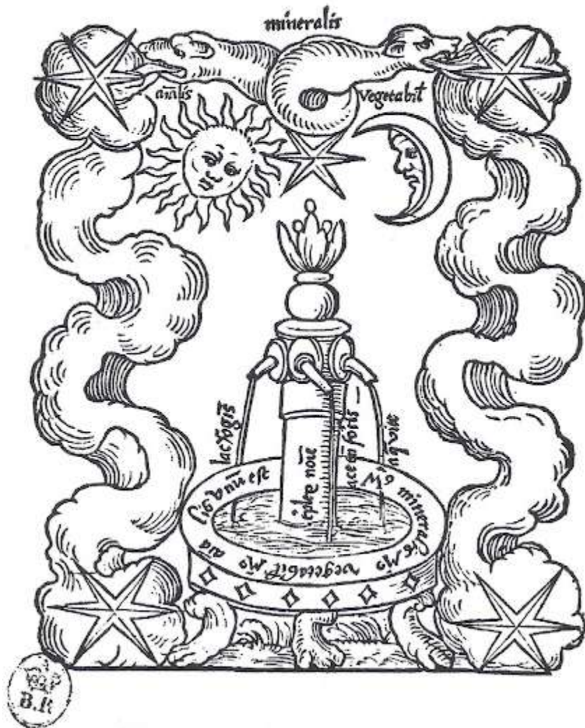
La fuente mercurial del “Rosarium Philosophorum” donde aparece el “opus in toto”

es posible concebir una correspondencia entre el mundo interior del alquimista y el mundo exterior de la materia. De este modo, la transmutación de la materia en el laboratorio es un reflejo de la transformación del alma del alquimista.